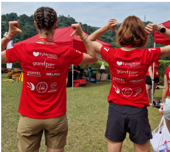
T-shirt officiel du Raid Amazones avec personnalisation sur mesure

Exemples: vestes, pulls, t-shirts, casquettes, etc dépendamment des contraintes techniques imposées par les matières et leurs usages