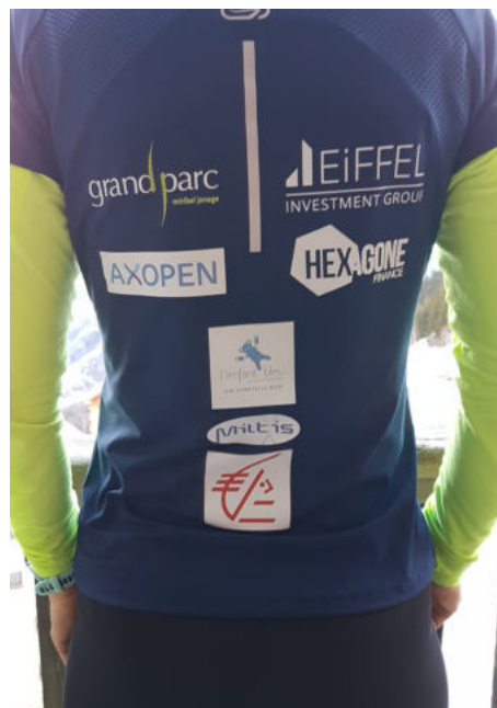
T-shirt sur mesure